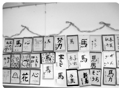
所狭しと皆様の書き初めが並んでいます

デイサービスでは、新年早々に「日本のお正月」にちなんだ取組を行いました。 毎年恒例の「新年会」に始まり「初詣」「おみくじ」「書初め」と正月行事が目白押しです。デイサービスの壁面には書初めが所狭しと並んであります。お越しの際はぜひご覧下さい。