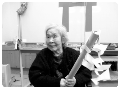
手作りの神社で幸運祈願です