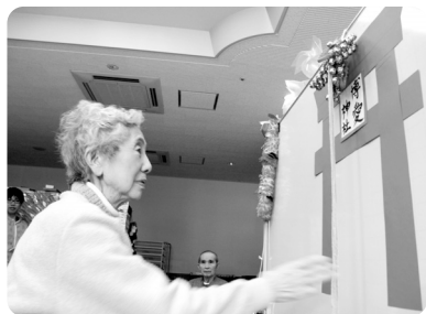
博愛神社に初詣。今年の運勢はどうか？