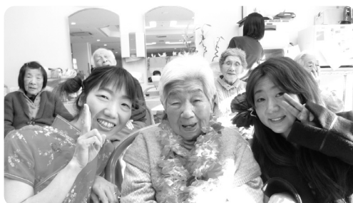
職員による「スーパーイリュージョン」の披露でお祝いをしました