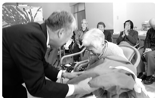
西村施設長より記念品のプレゼントです