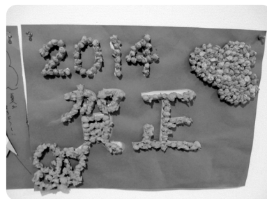
新年を祝う作品を作っていました