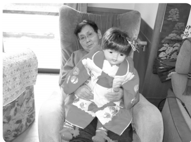
デイのアイドル「モモちゃん」も晴れ着に着替えました