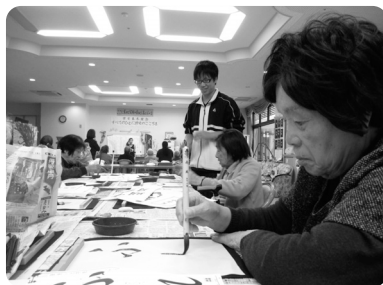
書初めは真剣そのもの

デイサービスでは、新年早々に「日本のお正月」にちなんだ取組を行いました。 毎年恒例の「新年会」に始まり「初詣」「おみくじ」「書初め」と正月行事が目白押しです。デイサービスの壁面には書初めが所狭しと並んであります。お越しの際はぜひご覧下さい。