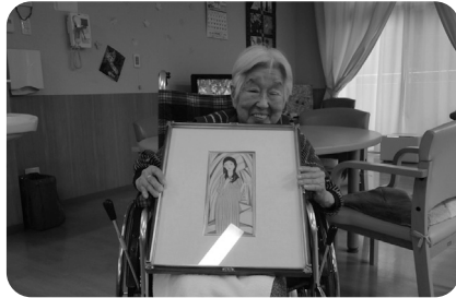
同世代の別嬪さんお二人

◆それでもな。ちよつとええ着物着せてもろて、花飾つて、白酒やる。甘いもん作つても