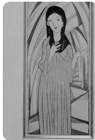
版画の少女は今も夢見る表情で祈ります

◆うちらそこまでしてもらえへん。田舎のことや。ほんでも、やっぱり、お祭りやでな。◆お母さんがな。ちよつとええもん、ちよつと美味しいもんを。皆様穏やかに頷かれます。雛祭りの日、激動の昭和を超え、想いはありし故郷を巡ります。