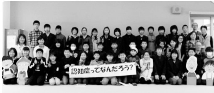
小学校で「認知症サポーター講座」開催