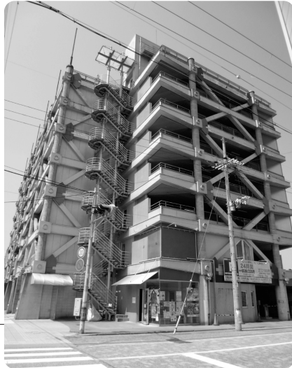
地域包括新事務所