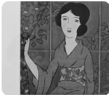
かつての「女の子たち」のあこがれ。竹久夢二は多くの版画も残しました