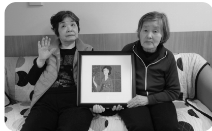
こちらも同年代の別嬪さんと