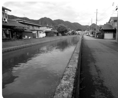
この川に謎の生物が!?