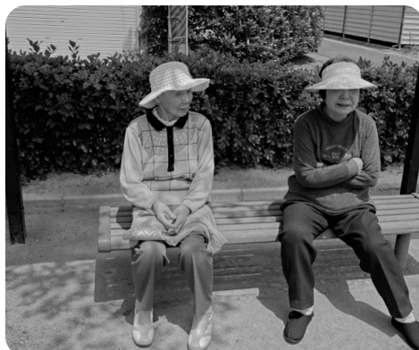
強い陽射し。お散歩に帽子は必需品

何事かと同行の職員に聞く。「はい。泳いでました。座布団、じゃなくて、エイが。」まさに座布団のサイズだったとのこと。タコの目撃例も。自然に恵まれた立地条件ならではのね。