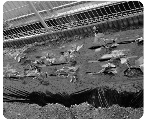
期待のニューフェースはサツマイモです。うーん、収穫が楽しみ!