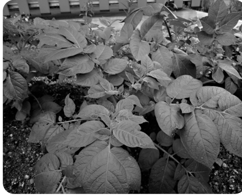
ジャガイモはこんなに大きくなりました!

先月始動した愛宕ミニミニ畑!! 現在、畑の名前を募集中です。入居者様のお知恵を拝借し、素敵な候補がいくつも挙がっています。間もなく投票で決定の予定。発表は次号にて。