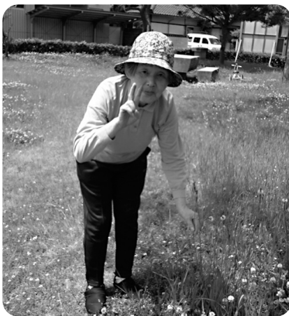
草花も綺麗な花を咲かせてます

川に座布団が落ちてましたか?とお聞きすると首を横に振られ、「落ちとらん。泳いどった。」はい?座布団って、泳ぎましたっけ?「泳いどった。」確信を持って断言されます。