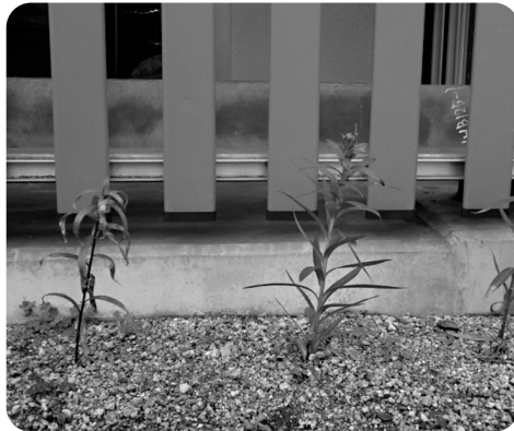
百合もそろそろ生育中。何色でしょうか?