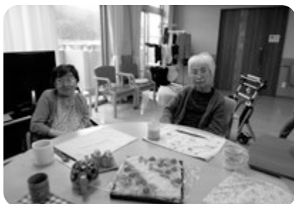
ほんと、カラーでお見せできないのが残念です