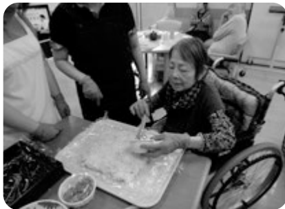
ここをこうして、と。昔を思いだすわね

今回は趣向を変えて、ご利用者の皆様にお作りいただきました。材料は酢飯のほかに刻み高菜、とびっこ、錦糸卵、かにほぐし身等。平たく整形した酢飯に各材料を並べ、更に酢飯を重ねて、また具を乗せて。白いご飯に高菜やきぬさやのグリーン、とびっこのオレンジとプチトマトの赤が映えます。「綺麗！」「味も最高やね！」カラーでお見せできないのが残念です。