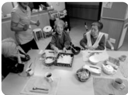
切り分けるのが勿体ない！