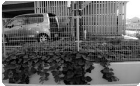
見事に育った芋づる。うーん美味しそう！

ご覧の通り、初めてのサツマイモ収穫としては中々の出来でした。サツマイモの後にはチューリップの球根を植えました。早くも来年の春に思いを馳せる、みんな仲良し畑です。