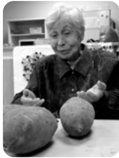
こんなに大きくなりました