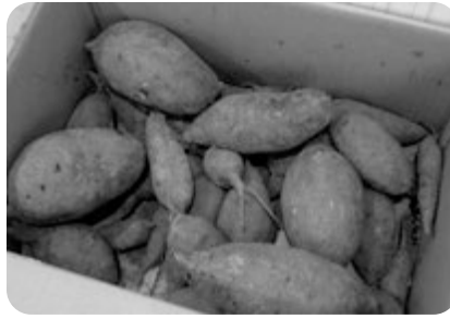
どんなお料理になるのでしょうか？