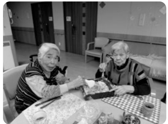
具を均一にちらします