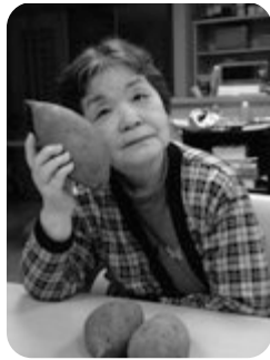
どう？顔より大きいんとちゃう？