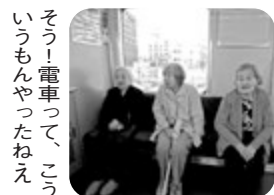
そう！電車って、こ ういふもんやったねえ