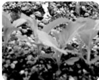
本葉も出そろい元気いっぱい

越冬準備は万端。その横には葉 ポタンの種が見事に発芽し、柔ら かな緑いろ の葉がすく すくと成長 中。 種まきは ご利用者 にお手伝 いいただき ました。葉 ポタンらし い色が出 るまで今 少しの辛 抱です。