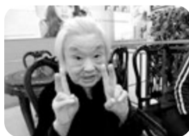
ああ満足！ 帰りたくない

去る11月21日は金曜日、愛宕ケアでは電車での外出を行 いました！ 懐かしのSLからリニアまで、鉄道には誰しも旅 心をそそられるもの。ご入居者は普段、電車に乗られる機会 はほとんどありません。中には、「気が付けばもう10年以上 乗ったことないわ」とおっしゃる方も。そんな 皆様の強い要望にお応えしての催行です。東 西舞鶴間という短かい時間ではありましたが、皆様久し振りに電車の雰囲気を楽し みました。今度はもっと長く乗りたい、でき たら天橋立や嵐山やら行ってみたい所は沢 山ある、と夢は膨らみます。遠方は難しくと も、お一人でも多くの方に御参加いただける よう職員一同今後とも努力して参ります。