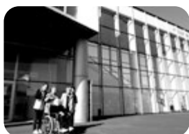
空は青空、お出かけ日和!