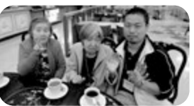
ショッピング の合間にコー ヒーブレーク