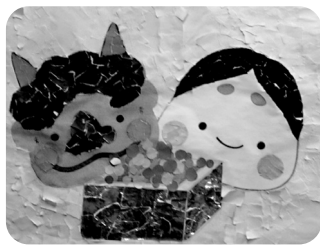
少し情けない鬼ですが...