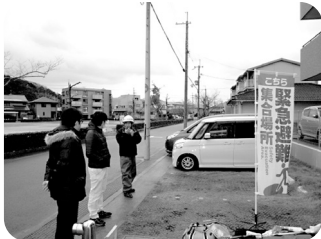
二次避難場所での避難本部設置完了!

2月2日(月)、小雪のちらつく中、グリーンパーク愛宕で今年度2回目の消防総合訓練を実施しました。愛宕では本年度は年