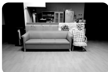
ソファーや椅子もゆったり置けます