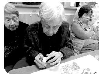
あら? 糊付けるのこっちと違うような

ご覧の通り愛宕ケアハウスでは節分の貼り絵を作成しました。色紙をちぎっては貼り、貼ってはちぎり、「手が糊でべたべたになっちゃった!」「いやあ、どうしょ? 表に糊付けてしもたやん。」「豆どないするん? 丸うちぎるん難しいわ!」「そこ色違うで!」