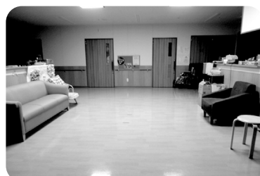
こんなに置いてもまだ余裕!