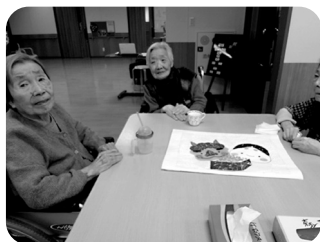
色? これでええんと違いますか?

「あああ! はみ出した!」「そんなもん、上から貼ったらわからへん。」と大騒ぎ。皆様のパワーの前には鬼も形無しです。