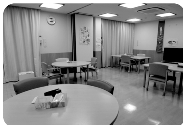
食事テーブルはコンパクトに移動