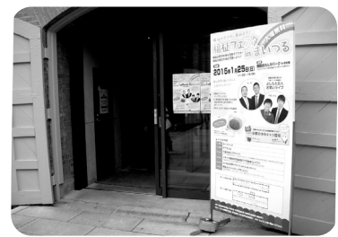
福祉フェスタinまいづる4号棟入口!