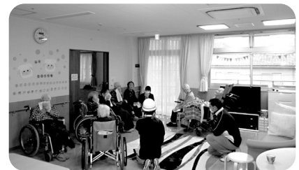
煙を避けるためにタオルで口を覆い、共同生活室に集合!

の消防訓練を計画しており、今回は夜間に火災が発生したと想定しての訓練でした。スプリンクラーが設置してあるとはいえ、少ない職員数で入居者の皆様に安全に避難していただくのは大変で、特に最近問題視されてきている煙対策に重点を置いて訓練を行い、無事終わることができました。訓練を行う中で様々な課題もみえてきたりして、今後も気を引き締めて防火・防災対策を行っていきたくと考えます。