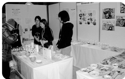
簡単!おいしいみんなで長寿飯体験

感じてもらうたいということで、京都府北部福祉人材確保・定着戦略会議主催の『福祉フェスタinまいづる』が開催されました。当法人からは2名の栄養士が舞鶴特養栄養士部会が介護食を紹介するコーナーでスタッフとして参加しました。