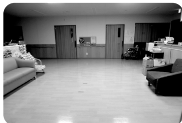
広い多目的スペースです

グリーンパーク愛宕が開設され3年が経ち、ケアハウスの共同生活室のテーブルとお食事席の配置を変更しました。その結果、ひまわりキッチンとなでしこキッチンの間に、今までより格段に広い多目的スペースができました。レクリエーションはもちろん、ソファーでゆっくり寛いでいただけます。車椅子のご利用者も楽々方向転換できる広さがあり、アイディア次第で、さまざまな活用方法が期待できます。おしゃべりなどご入居者同士の交流の場としても広く使えそうですね。