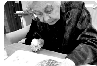
ここをこうして、と。しっ かり押さえなあかんね