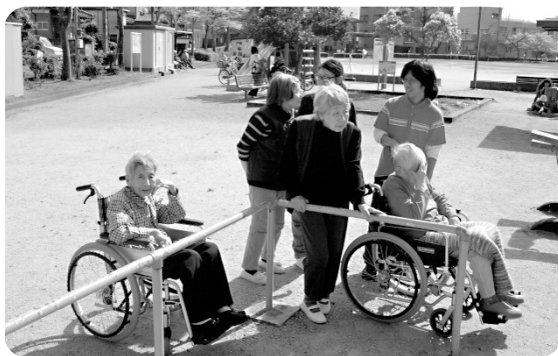
ブランコがあるね。乗ってみようかな…