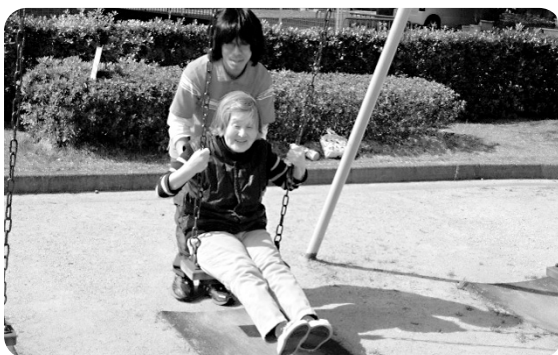
揺られていると、懐かしい昔を思い出します!

天気がよいので「皆で外へ行きましょう!」ということので、施設の目の前にある竜宮公園へお散歩に行きました。公園の中を歩くだけでも陽の暖かさに上着もいらぬほど。あるご利用者様はブランコにも挑戦されました。職員に背中を押されて揺られる姿に、青春時代を思い出されているような雰囲気を感じられました。暖かい陽射しにみなさん「気持ちがいいわ」「空気がおいしい」と日光浴を楽しみました。ここはすぐに行けて、ご近所の子どもさんたちの遊ぶ姿もみることができ、短い時間で気分転換するにはもってこいの公園です。晴れの日にはまたお散歩にいきましょうね!