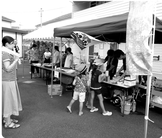
▶竜宮町かき水屋台

蔵盆に、近隣地域への感謝の気持ちを含めて2日連続で参加させていただきました。両方の地蔵