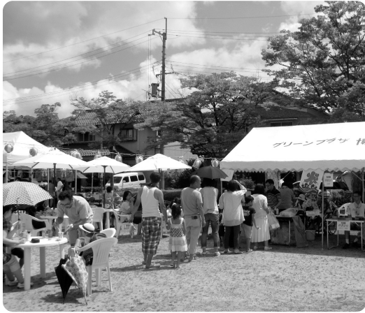
▶愛宕新かき水屋台