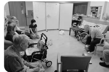
レク時間以外でもパズルを使い頭の体操♪

以前はいくつかの曜日だけレクリエーション内容が決まっていたのですが、先月より曜日毎に内容が決まりました！身体を動かすゲームやホワイトボードを使用した言葉遊び。職員による紙芝居もあります。