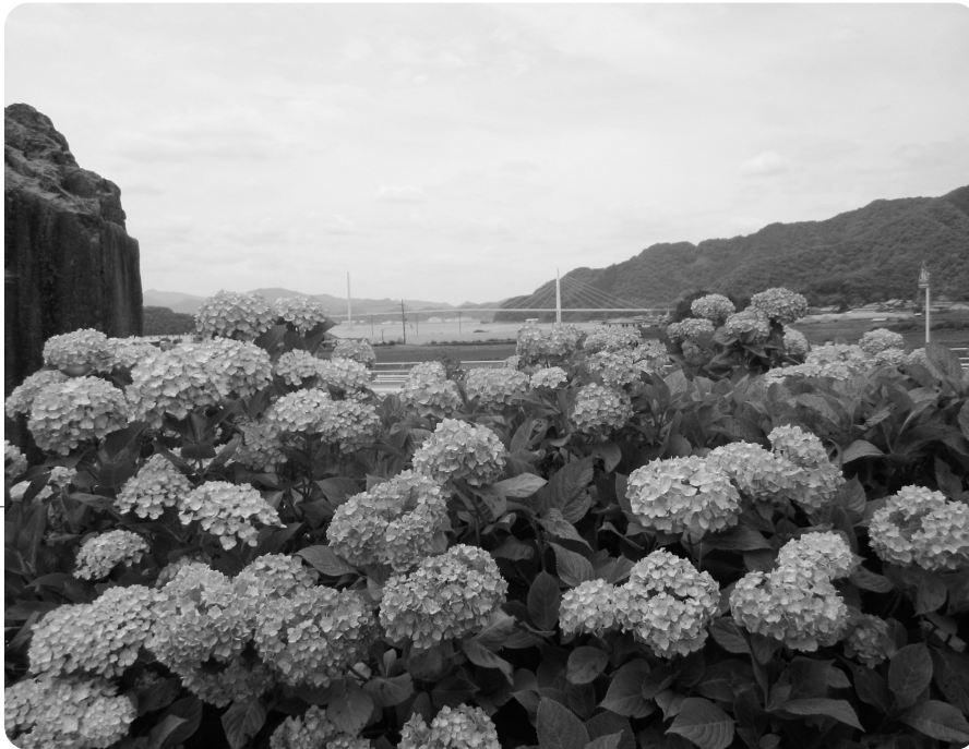
咲きこぼれるアジサイ (後方クレインブリッジ)

6月初旬には近畿地方も梅雨に入り、雨の日も少し増えてきました。この時期を待ち望んでいたかのように、各地でアジサイの花が活き活きと咲き始めています。 今年春からこの時期までの雨が少なかったため、例年より少し遅れて、丁度今、満開の時期を迎えています。利用者の皆様と一緒に観に行くのが楽しみです。