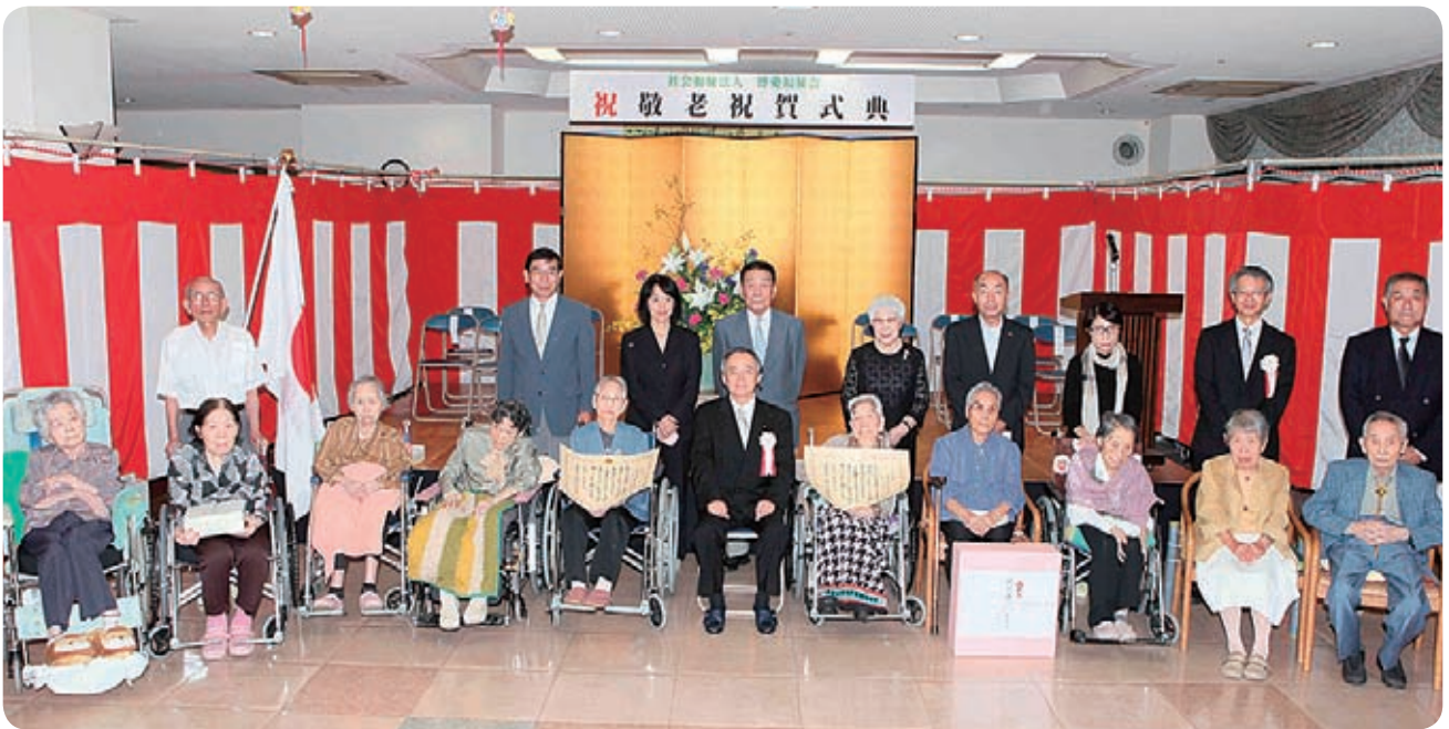
▲グリーンプラザ博愛苑敬老祝賀式典