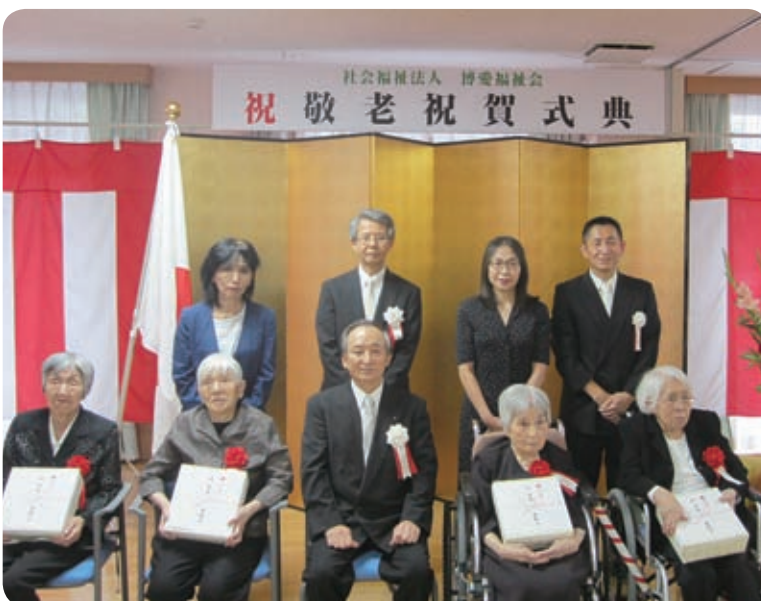
▲グリーンパーク愛宕敬老祝賀式典

平成28年度博愛福祉会の敬老祝賀式典が9月13日(火)にグリーンプラザ博愛苑で、そして16日(金)にグリーンパーク愛宕で京都府知事様、舞鶴市長様、舞鶴市議会議長様他、多数の御来賓をお迎えして行われました。岸本理事長の式辞での長寿十カ条のお話に続いて、御来賓からの御祝辞をいただき、また多数の御家族様も御出席くださり、盛大な式典となりました。 入居者の皆様の御長寿、誠におめでとうござい ます。職員一同、今後の益々の御健康を心からお 祈りいたします。